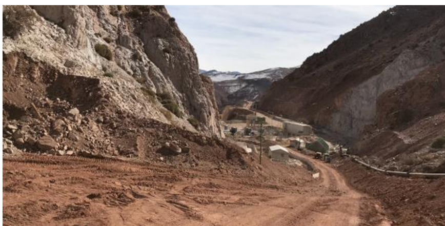
Fotografía 8: Vista del camino una vez realizados los trabajos de retiro.

En las siguientes fotografías se muestran los resultados obtenidos una vez realizada la limpieza.