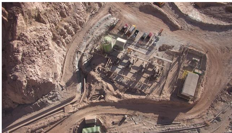
Fotografía 15: Vista aérea de la reposición del camino.

Una vez realizados los trabajos de limpieza y retiro de residuos, y cubrimiento de las tuberías, se procedió a reponer el camino para la libre circulación de las actividades propias de la operación. En las siguientes fotografías se muestra la reposición del camino.