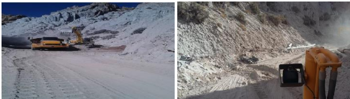
Fotografías 6 y 7: Maquinaria pesada removiendo suelo con derrames de lamas.

En las siguientes fotografías se muestran los resultados obtenidos una vez realizada la limpieza.