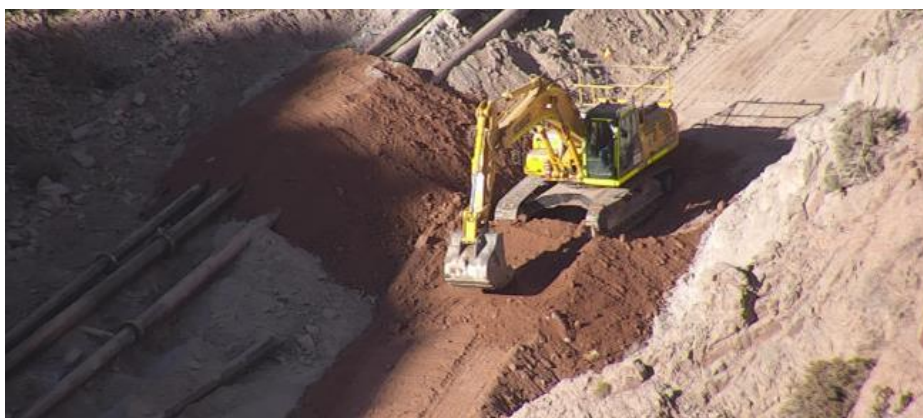
Fotografía 13: Cubrimiento de tuberías mediante maquinaria pesada.

El trabajo de tapado de tuberías se realizó entre los días 7 de junio y 2 de julio, utilizando para ello maquinaria pesada. En las siguientes fotografías se muestra el trabajo realizado.