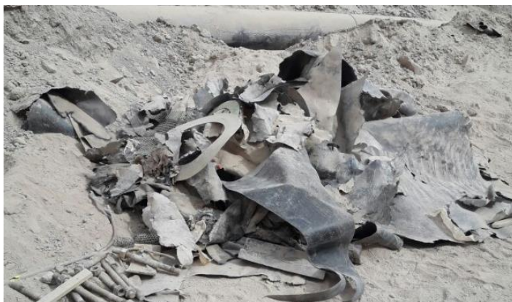
Fotografías 4: Residuos acumulados en el sector.