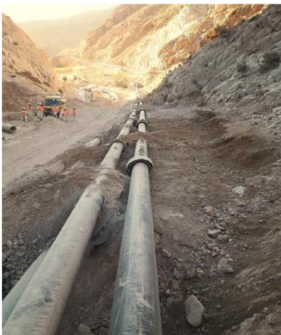
Fotografías 10 y 11: Sector de tuberías limpio de lamas