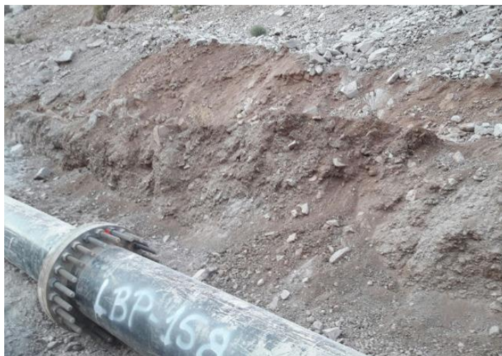
Fotografías 5: Inicio de remoción de suelo con derrames de lamas.