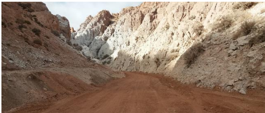
Fotografía 16: Reposición del camino