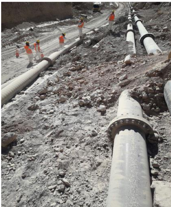
Fotografías 1, 2 y 3: Limpieza manual realizada por cuadrillas de trabajadores.