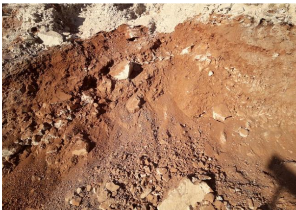
Fotografías 9: Detalle del suelo una vez removidas las lamas