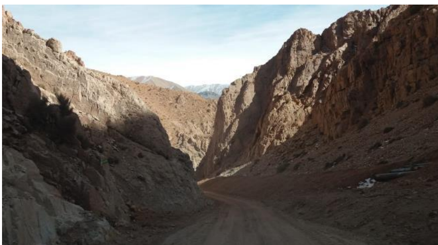
Fotografía 12: Vista del camino despejado de residuos y suelos con derrames de lamas